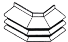
Çift Gönye (Dik)